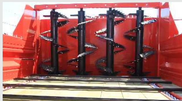
ORION 60-PRO: verižni transporter ima dve veriği 10 x 31 iz jekla visoke kvalitete in kovinske stranice.