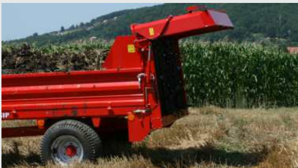
ORION 60-PRO in 60H-PRO: Hidravlični dvig zaščite trosilnih valjev..