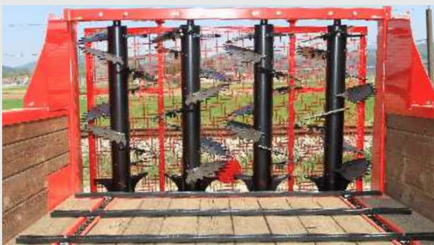
ORION 40R-CL: verižni transporter ima dve veriği 8 x 31 iz jekla visoke kvalitete in lesene stranice.