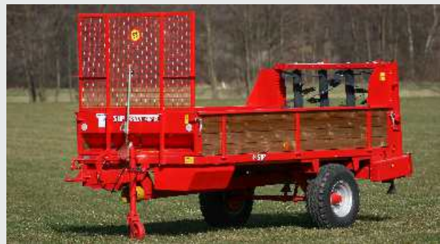
ORION 40R-C z mehansko zaščitno mrežo za trosilne valje, ki se uporabi kot zaščitna stena na sprednji strani.