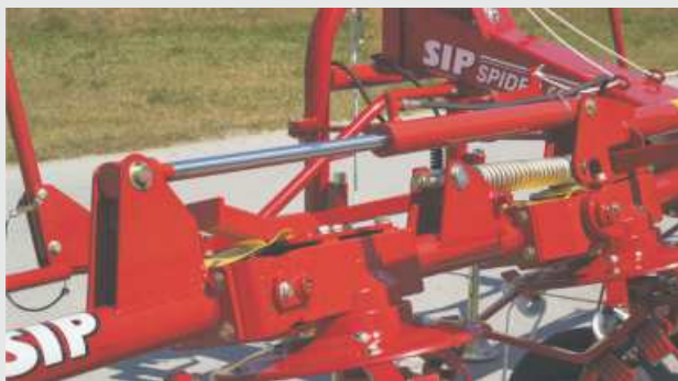
Hidravlični dvig vrtavk serijsko (SPIDER 455-815).