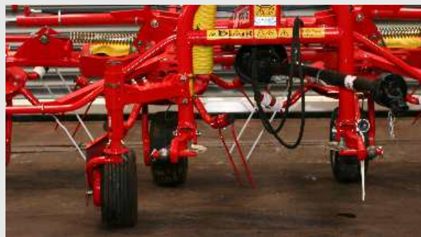
Podporna kolesa z večstopenjsko nastavitvijo višine in hitro nastavitvijo kota trošenja.