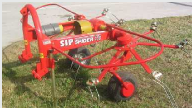
Spider 230 je obračalnik z dvema vrtavkama in s fiksno izvedbo priklopa in dvema gibljivima kolesoma. Lahka izvedba zagotavlja okretnost in malo vzdrževanja.