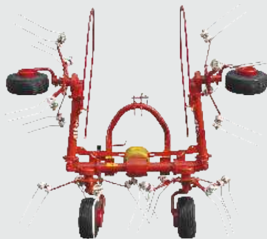
Tipa obrabnikov SPIDER 350 in SPIDER 400 se enostavno zlagata v transportni položaj. Možnost je tudi dodatna hidravlična oprema za dvig vrtavk.