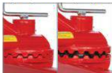
Zupčana ploča za namještanje kuta