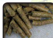
PELETE OD GRMLJA