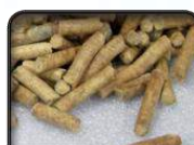
PELETE OD SMREKE - JELE