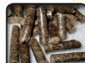
PELETE OD LJUSAKA KESTENA