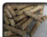
PELETE OD ČETINARA