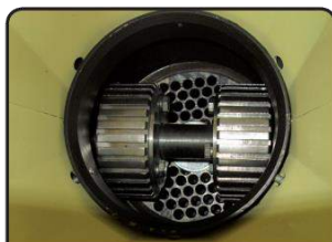
SABIJAJUĆI VALJCI ZA ULAZ USITNJENOG MATERIJALA